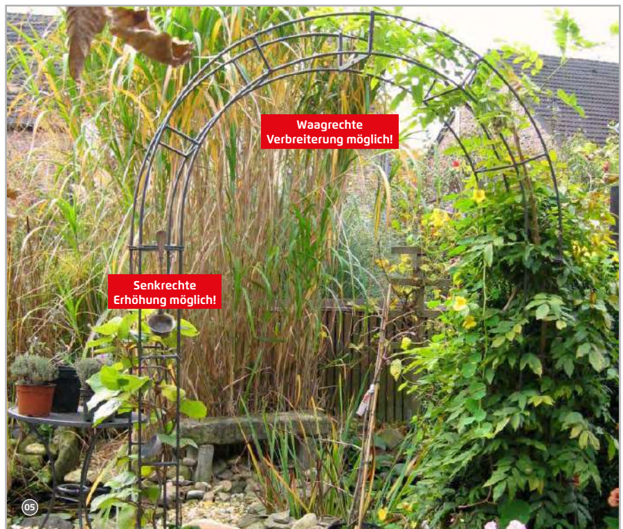
Die Bauteile können in der Höhe und der Breite erweitert werden!

Sie können Ihren Rosenbogen nach oben oder in die Breite verlängern. Wir fertigen Ihnen Verlängerungsstücke nach Maß. Sie benötigen dazu immer zwei Passstücke, im gleichen Format in der Breite oder Höhe des Rosenbogens. Durch die massive Bauweise des Rosenbogens werden auch alte, schwere Rankpflanzen wie z.B. Blauregen dauerhaft stabil abgestützt.