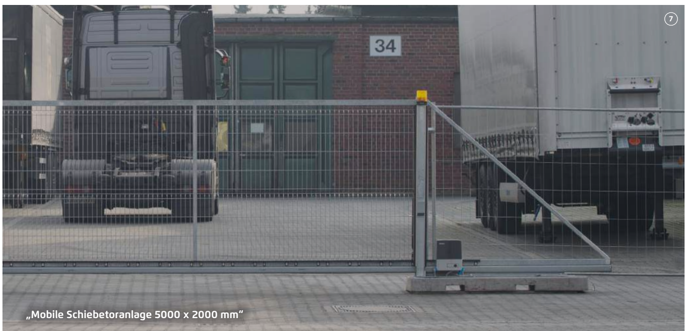
„Mobile Schiebetoranlage 5000 x 2000 mm“

Allgemeines Zubehör: - Sichtschutzplanen - Aushebesicherung - Befestigungssatz - Bauzaunabstützung