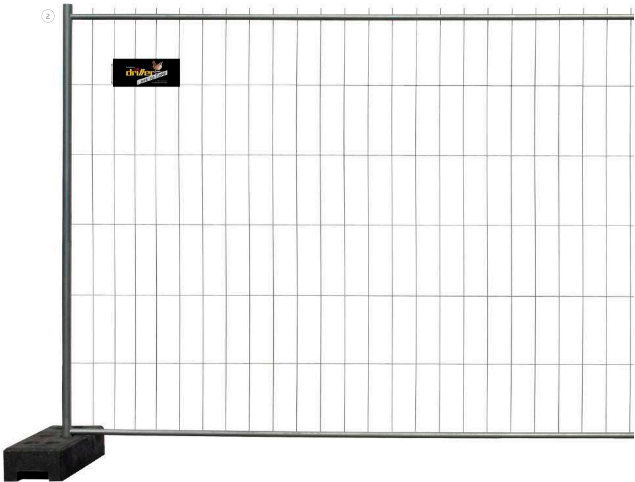
„Mobilzaunmatten mit Driller-Etikett Typ medium“