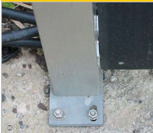
Pfostenverankerung auf Beton!