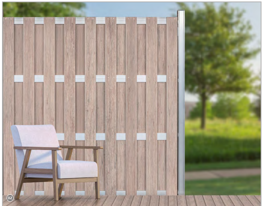
Stilvolles WPC mit Aluminium kombiniert!