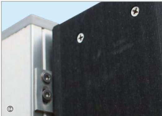
Befestigung der Elemente am Pfosten!